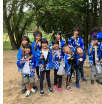
参加した子ども太鼓のメンバー

が演奏され、みんなのびのびと太鼓を披露しました。くならず、地域のコミュニティはきちんと存在し、昔から続いている大切な行事は大人から子どもたちへきちんと受け継がれ、守られていきます。大祭当日は練習の成果が発揮され、みんなのびのびと太鼓を披露しました。