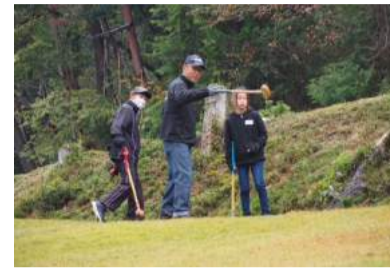
コースをまわる参加者