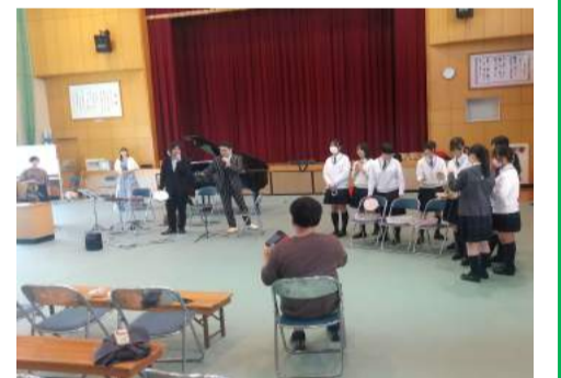
大阪音楽大学OBによる演奏のようす

去る11月3日、「第7回川合元気祭り」が、好天に恵まれ旧川合小学校で開催されました。来場者は500人を超え、中庭でのバザーや、体育館の物販コーナーもたくさんの方が訪れ、当日は10時15分から「よさこい絆」の演奏で幕を開け、続いて開会式、その後「福知山成美高校吹奏楽部」の演奏に移り、曲の中には懐かしい曲もありみなさん喜んでおられました。次は、大阪音楽大学の卒業生で構成された「今様音楽企画」のコンサートが行われ、美しい音色を会場に届けてくれました。午後は、福知山公立大学の学生が企画した室内モルックや室内ペタンクの遊び方教室が開催され、子供たちが真剣に取り組みでいました。祭りの締めくくりは、恒例の大ビンゴ大会となり、最後まで残った150名が景品獲得を目指して盛り上がりました。尚、当日は初めて有償運送「みわひまわりライド」(三和地域協議会)と契約し、参加者の会場送迎を行いました。