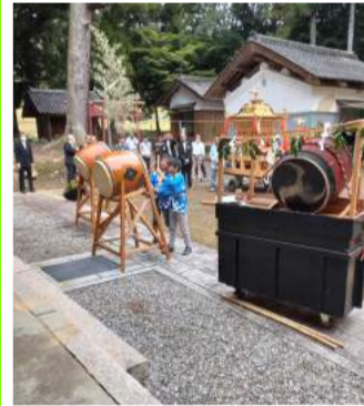
太鼓をたたくようす

が演奏され、みんなのびのびと太鼓を披露しました。くならず、地域のコミュニティはきちんと存在し、昔から続いている大切な行事は大人から子どもたちへきちんと受け継がれ、守られていきます。大祭当日は練習の成果が発揮され、みんなのびのびと太鼓を披露しました。